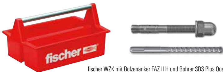
fischer WZK mit Bolzenanker FAZ II H und Bohrer SDS Plus Quattric II